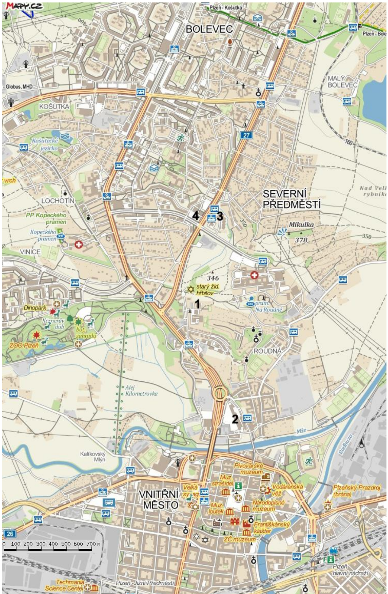
Celkový plán Plzně pro individuální prohlídku města